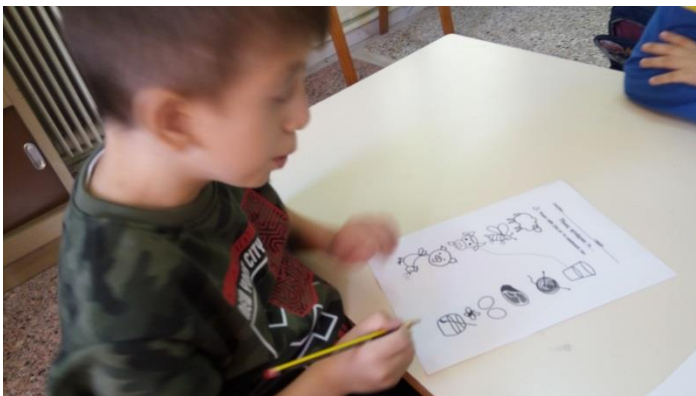
φύλλο εργασίας για ζωικά παράγωγα