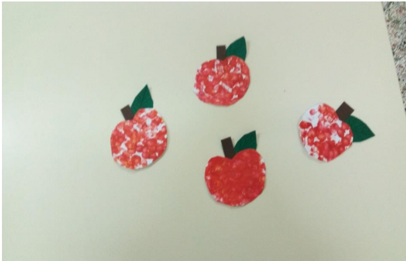
Στάμπα με τουβλάκι