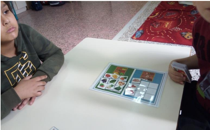
Ταξινόμηση ζωικές/φυτικές τροφές