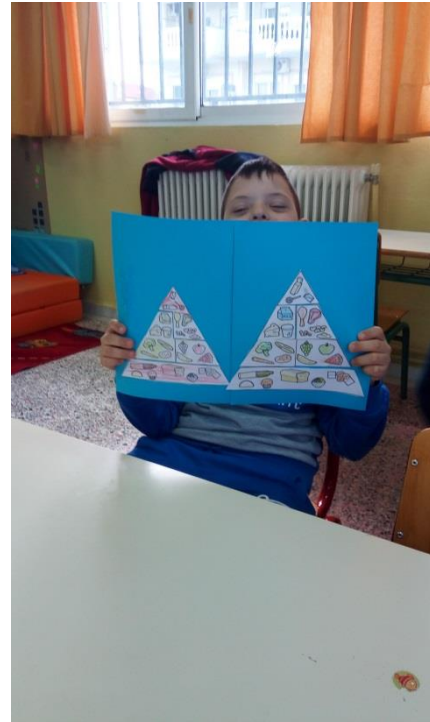
Σχηματισμός Μεσογειακής πυραμίδας