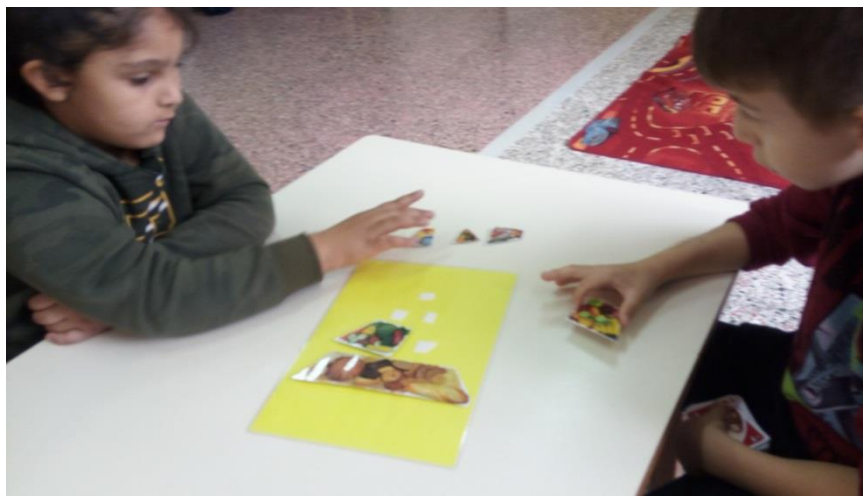
Σχηματισμός Μεσογειακής πυραμίδας