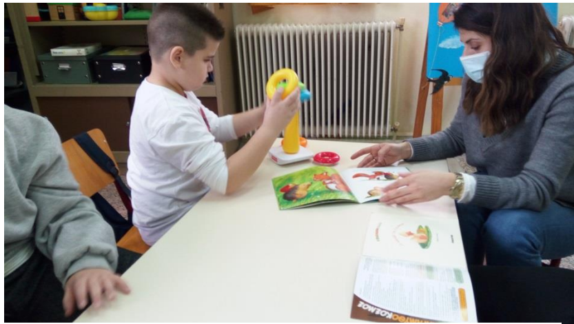
Τα παιδιά έρχονται σε επαφή με τα φρούτα και τα λαχανικά μέσα από εικαστικές δραστηριότητες