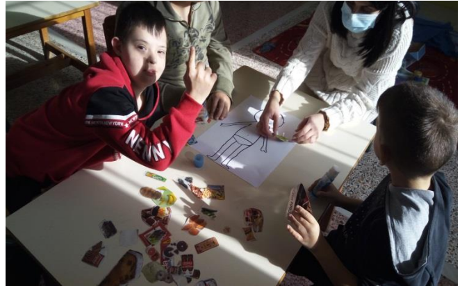
Κολλάζ /διαχωρισμός υγιεινών-ανθυγιεινών τροφών (ο Κύριος Υγιεινός και ο κύριος Ανθυγιεινός)