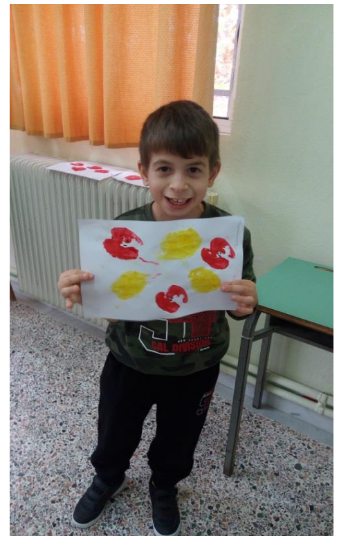
Στάμπες από μήλα και λεμόνια